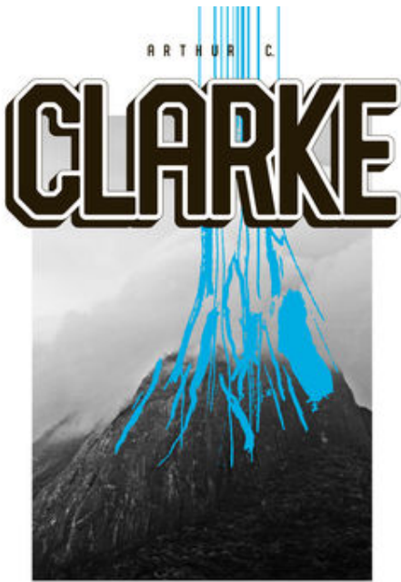
AS FONTES DO PARAÍSO

Há dois séculos, Kalidasa desafiou sua família e sua religião para empreender uma verdadeira maravilha arquitetônica: a construção de um suntuoso palácio no topo de uma montanha, que o alçaria aos céus e o igualaria aos deuses. Duzentos anos depois, o ambicioso engenheiro Vannevar Morgan, que já unira dois continentes com a Ponte Gibraltar, se propõe a construir uma nova ponte, desta vez ligando a Terra ao espaço sideral. O que ele não imagina, porém, é que em seu caminho está um monastério budista, localizado sobre a única montanha na qual seu projeto poderia ser construído. Em paralelo, a humanidade detecta um estranho sinal de rádio, de origem não humana. Pela primeira vez na história, o planeta Terra é contatado por uma raça alienígena que, ao que tudo indica, está cada vez mais próxima.